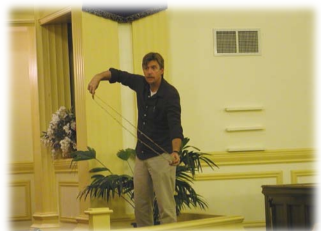
大衛做了精彩的見證，演示了非洲的民族服裝穿着方法（左）并示範了據說是舊約中的大衛曾經用過現在在非洲當地還很流行的甩石器（右）