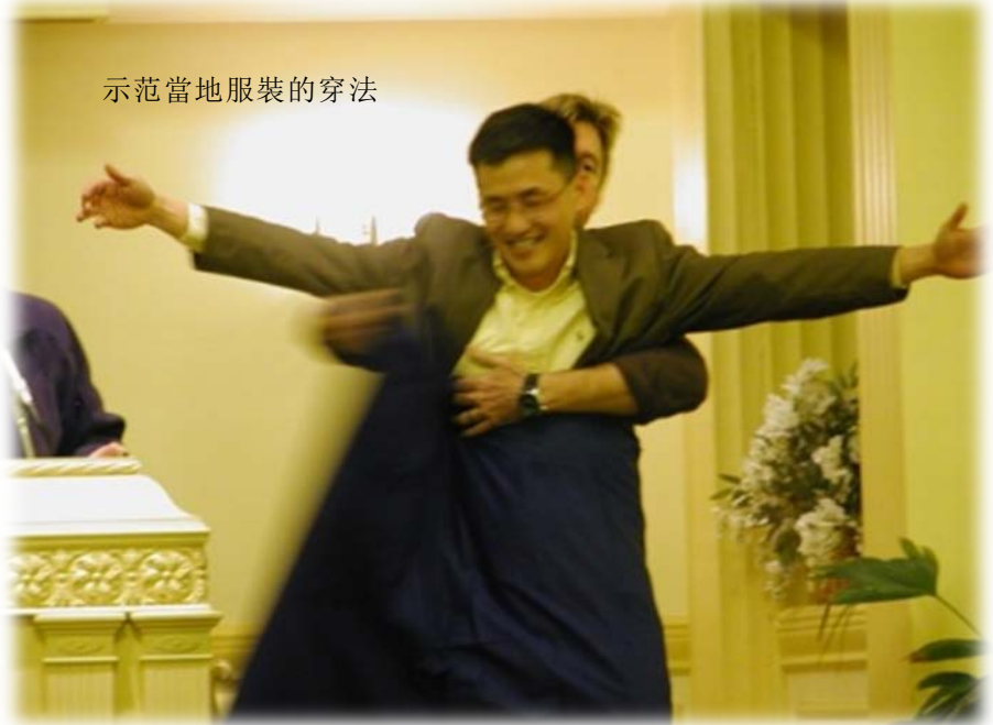
示范當地服裝的穿法

我要送些禮物給幾位朋友。這個是MAOUWEIS，我想讓你們把這個穿上，它是個像裙子一樣的衣服，這是索馬里人平常穿的衣服，而且是男人要穿的衣服。這不是裙子哦，是MAOUWEIS。假如你比較懂顏色的話，這個紅色的圍巾PADAFEI。通常可以通過衣服的颜色來分辨是保守派還是自由派。還有一個禮物是給教會的，是駝鈴。還有兩個禮物