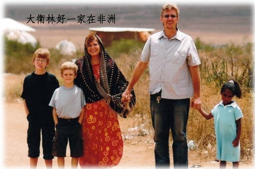
大衛林好一家在非洲