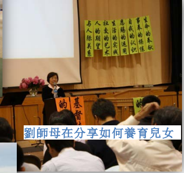
劉師母在分享如何養育兒女