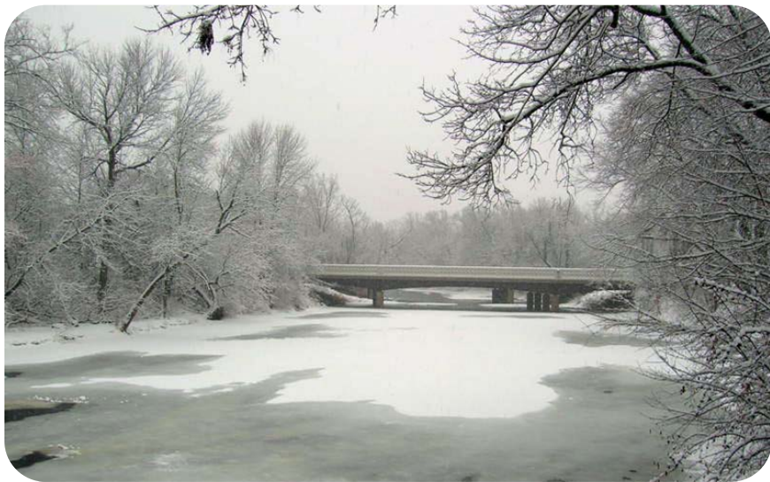
冬日的米爾沃基河

Chinese Christian Church of Milwaukee 3069 N. Downer Ave. Milwaukee, WI 53211