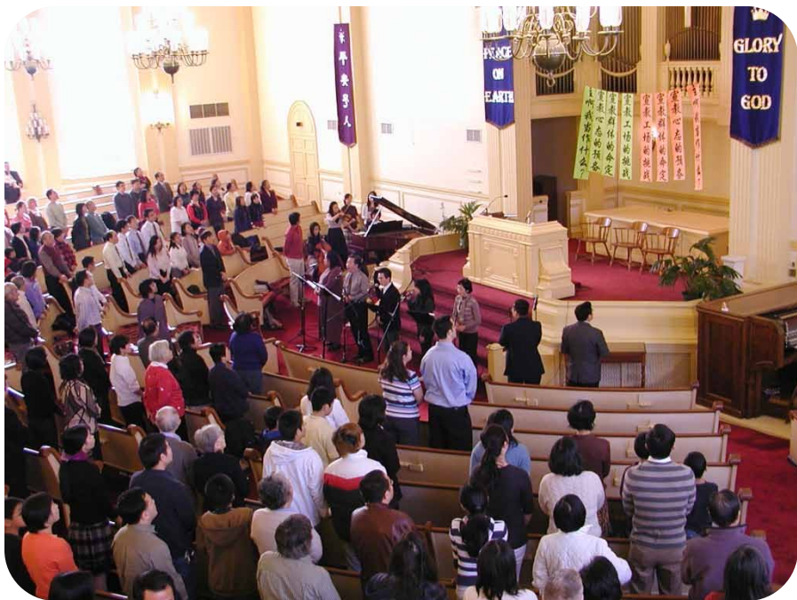
2010年教會差傳年會

Chinese Christian Church of Milwaukee 3069 N. Downer Ave. Milwaukee, WI 53211