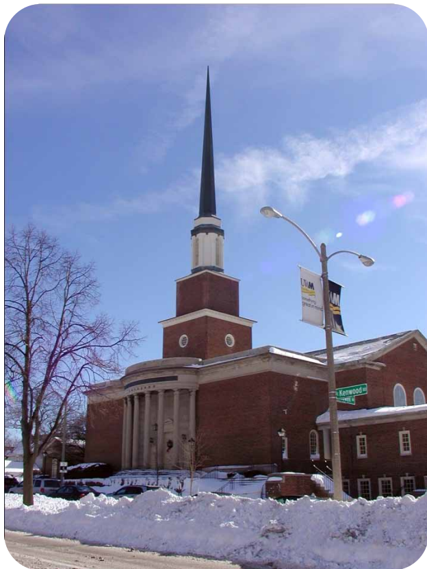
米城中華基督教會

Chinese Christian Church of Milwaukee 3069 N. Downer Ave. Milwaukee, WI 53211