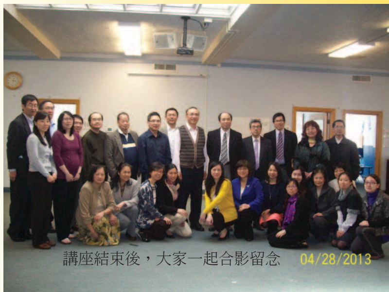
講座結束後，大家一起合影留念 04/28/2013

《十步釋經法》由賴牧師編著，一直以來都深受廣大弟兄姐妹歡迎，在亞馬遜的圖書評價為五星。舒瑞允長老根據這本工具書，通過觀察、解釋與應用這三層架構，以《路得記》為例，幫助學員掌握從理論至實踐，從實踐至應用的查經步驟及釋經原則。（金浩整理，照片由歐袁清提供）