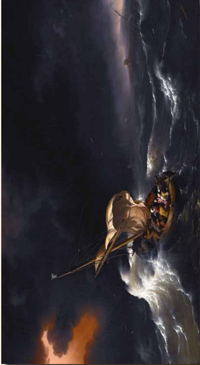
基督在加利利海的風暴中 Ludolf Backhuysen, 1695

Chinese Christian Church of Milwaukee 3069 N. Downer Ave. Milwaukee, WI 53211