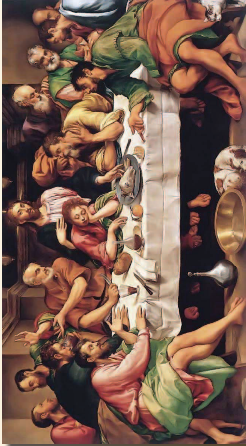
最後的晚餐 Jacopo Bassano 1542

Chinese Christian Church of Milwaukee 3069 N. Downer Ave. Milwaukee, WI 53211