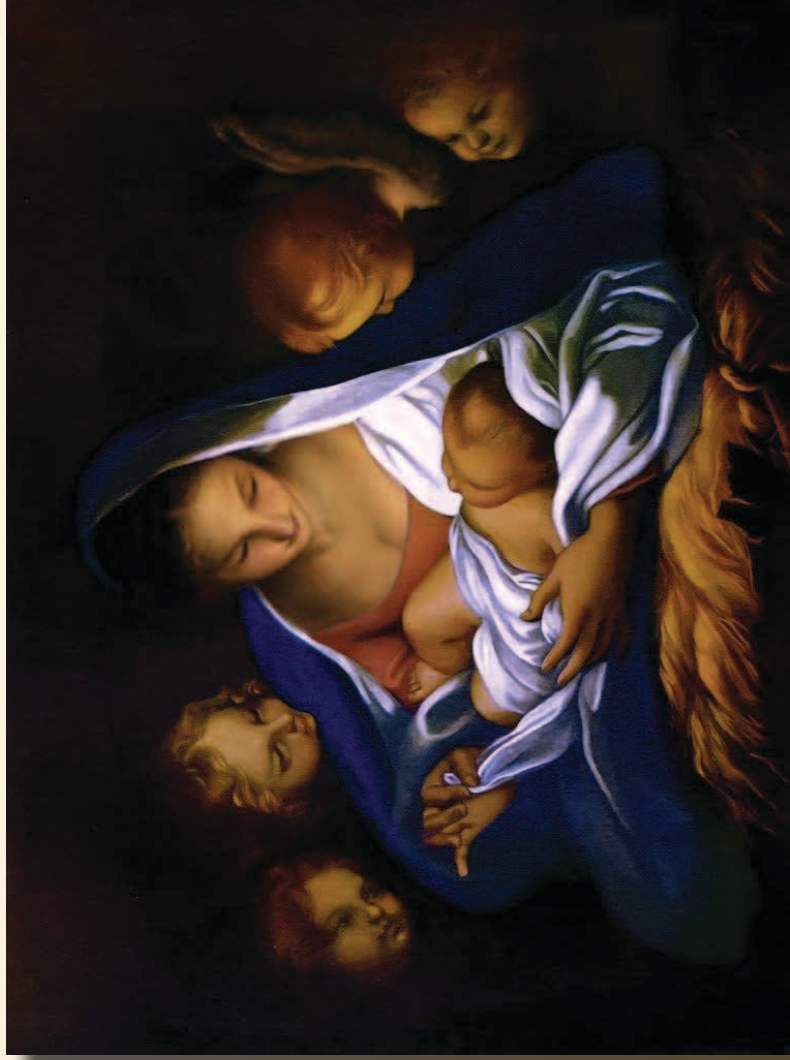
聖善夜 Carlo Maratta, 1689

Chinese Christian Church of Milwaukee 3069 N. Downer Ave. Milwaukee, WI 53211