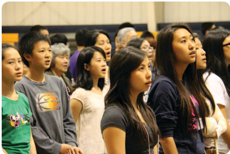
米城教會的年輕人

今天，我們基督徒要接受耶穌為救主，我們在這裡宣教，讓大家到教會來，教會要訓練門徒。我們教會要拼命地在做這個工作，這就是《聖經》中的大使命：使萬民做我的門徒，奉聖子的名給他